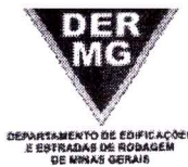
TABELA REFERENCIAL DE PREÇOS UNITÁRIOS PARA CONSULTORIA E PROJETOS