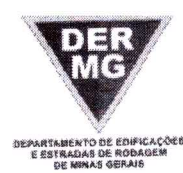
TABELA REFERENCIAL DE PREÇOS UNITÁRIOS PARA CONSULTORIA E PROJETOS Região Triângulo e Alto Paranaíba - C/ Desoneração ABRIL/2023