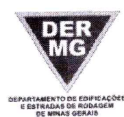
TABELA REFERENCIAL DE PREÇOS UNITÁRIOS PARA CONSULTORIA E PROJETOS Região Triângulo e Alto Paranaíba - C/ Desoneração ABRIL/2023