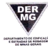
TABELA REFERENCIAL DE PREÇOS UNITÁRIOS PARA CONSULTORIA E PROJETOS Região Triângulo e Alto Paranaíba - C/ Desoneração ABRIL/2023