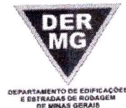
TABELA REFERENCIAL DE PREÇOS UNITÁRIOS PARA CONSULTORIA E PROJETOS Região Triângulo e Alto Paranaíba - C/ Desoneração ABRIL/2023