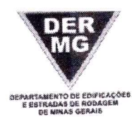
TABELA REFERENCIAL DE PREÇOS UNITÁRIOS PARA CONSULTORIA E PROJETOS Região Triângulo e Alto Paranaíba - C/ Desoneração ABRIL/2023