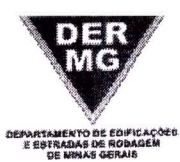
TABELA REFERENCIAL DE PREÇOS UNITÁRIOS PARA CONSULTORIA E PROJETOS