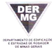
TABELA REFERENCIAL DE PREÇOS UNITÁRIOS PARA CONSULTORIA E PROJETOS Região Triângulo e Alto Paranaíba - C/ Desoneração ABRIL/2023