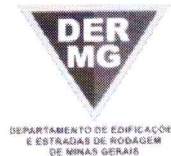
TABELA REFERENCIAL DE PREÇOS UNITÁRIOS PARA CONSULTORIA E PROJETOS Região Triângulo e Alto Paranaíba - C/ Desoneração ABRIL/2023