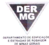
TABELA REFERENCIAL DE PREÇOS UNITÁRIOS PARA CONSULTORIA E PROJETOS Região Triângulo e Alto Paranaíba - C/ Desoneração ABRIL/2023