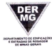
TABELA REFERENCIAL DE PREÇOS UNITÁRIOS PARA CONSULTORIA E PROJETOS Região Triângulo e Alto Paranaíba - C/ Desoneração ABRIL/2023