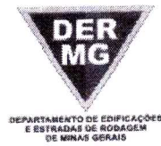
TABELA REFERENCIAL DE PREÇOS UNITÁRIOS PARA CONSULTORIA E PROJETOS Região Triângulo e Alto Paranaíba - C/ Desoneração ABRIL/2023