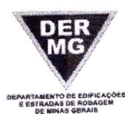
TABELA REFERENCIAL DE PREÇOS UNITÁRIOS PARA CONSULTORIA E PROJETOS Região Triângulo e Alto Paranaíba - C/ Desoneração ABRIL/2023