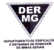
TABELA REFERENCIAL DE PREÇOS UNITÁRIOS PARA CONSULTORIA E PROJETOS Região Triângulo e Alto Paranaíba - C/ Desoneração ABRIL/2023