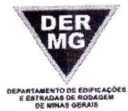
TABELA REFERENCIAL DE PREÇOS UNITÁRIOS PARA CONSULTORIA E PROJETOS Região Triângulo e Alto Paranaíba - C/ Desoneração ABRIL/2023