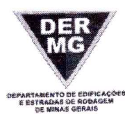
TABELA REFERENCIAL DE PREÇOS UNITÁRIOS PARA CONSULTORIA E PROJETOS Região Triângulo e Alto Paranaíba - C/ Desoneração ABRIL/2023