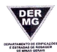
TABELA REFERENCIAL DE PREÇOS UNITÁRIOS PARA CONSULTORIA E PROJETOS Região Triângulo e Alto Paranaíba - C/ Desoneração ABRIL/2023