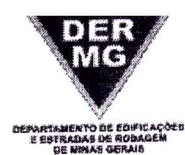
TABELA REFERENCIAL DE PREÇOS UNITÁRIOS PARA CONSULTORIA E PROJETOS