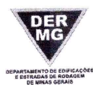
TABELA REFERENCIAL DE PREÇOS UNITÁRIOS PARA CONSULTORIA E PROJETOS Região Triângulo e Alto Paranaíba - C/ Desoneração ABRIL/2023