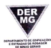
TABELA REFERENCIAL DE PREÇOS UNITÁRIOS PARA CONSULTORIA E PROJETOS Região Triângulo e Alto Paranaíba - C/ Desoneração ABRIL/2023