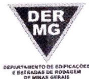
TABELA REFERENCIAL DE PREÇOS UNITÁRIOS PARA CONSULTORIA E PROJETOS Região Triângulo e Alto Paranaíba - C/ Desoneração ABRIL/2023